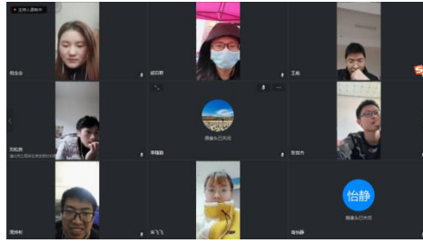
图 1 学习总书记讲话精神

1.2 “学”专业知识： 环境的保护需要运用我们的专业知识，我们所在的专业方向有许多优秀的党员教师，通过他们的言传身教，支部成员的认真学习，将我们的专业知识落实到保护生态文明的实处，为校园、社会贡献出一份力量。例如工业催化方向的李瑛老师团队，在李小年老师和刘化章老师等学科带头人的指导下，历经 8 年，开发的新一代单原子超稳低汞触媒 10 月份起全面投产，这意味着我国氯碱 PVC 行业的汞消耗将全面降低，从目前的吨耗 1.2kg/吨 PVC 降到 0.7kg/吨 PVC 以下，为我国的绿色化学事业做出了突出的贡献。